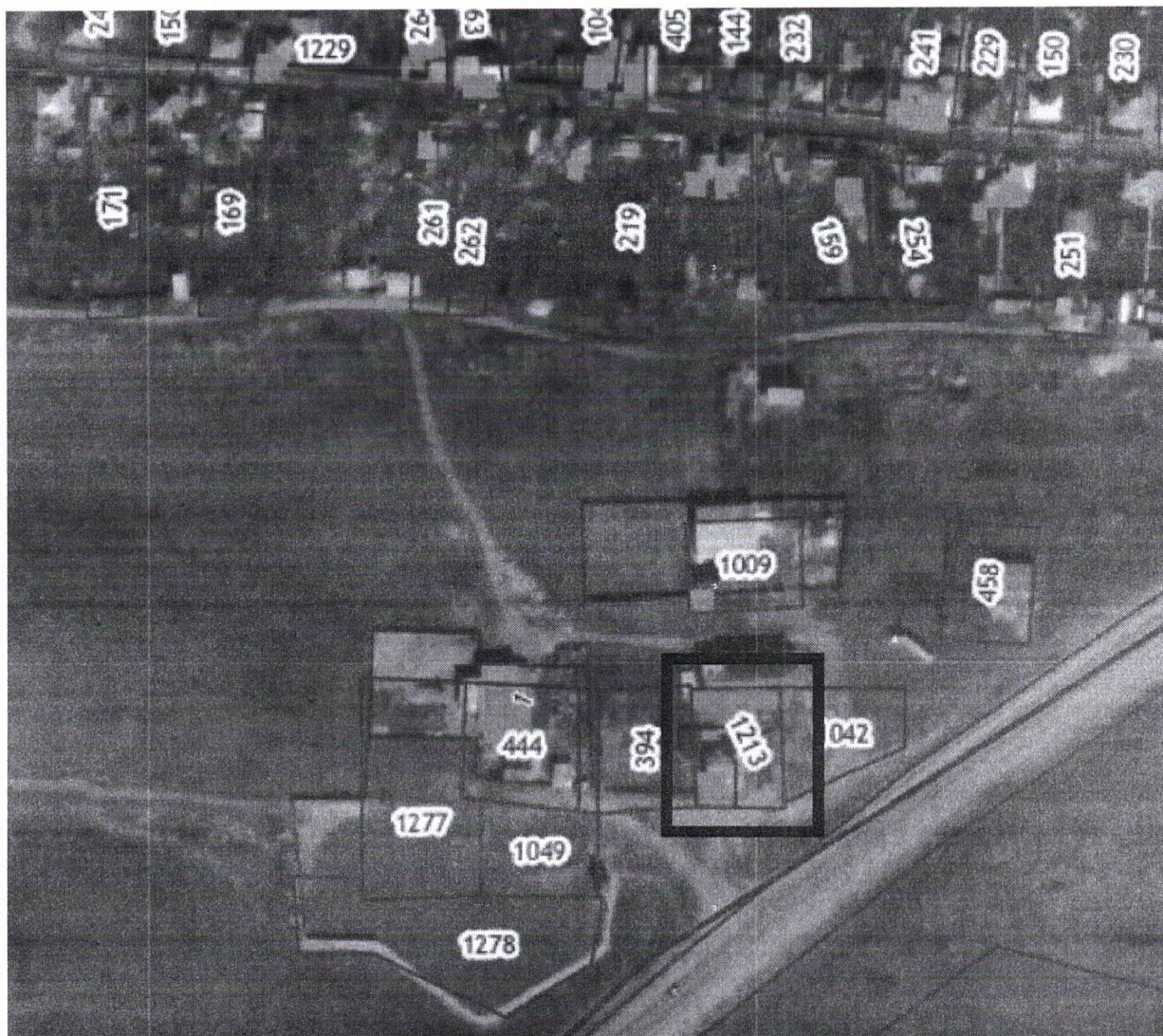
Схема границ разработки проекта межевания территории в районе земельного участка 46, 46 а по ул. Дорожная в п. Коксовый Белокалитвинского района Ростовской области

Приложение к постановлению Администрации Белокалитвинского района от 22 .07.2024 № 1021